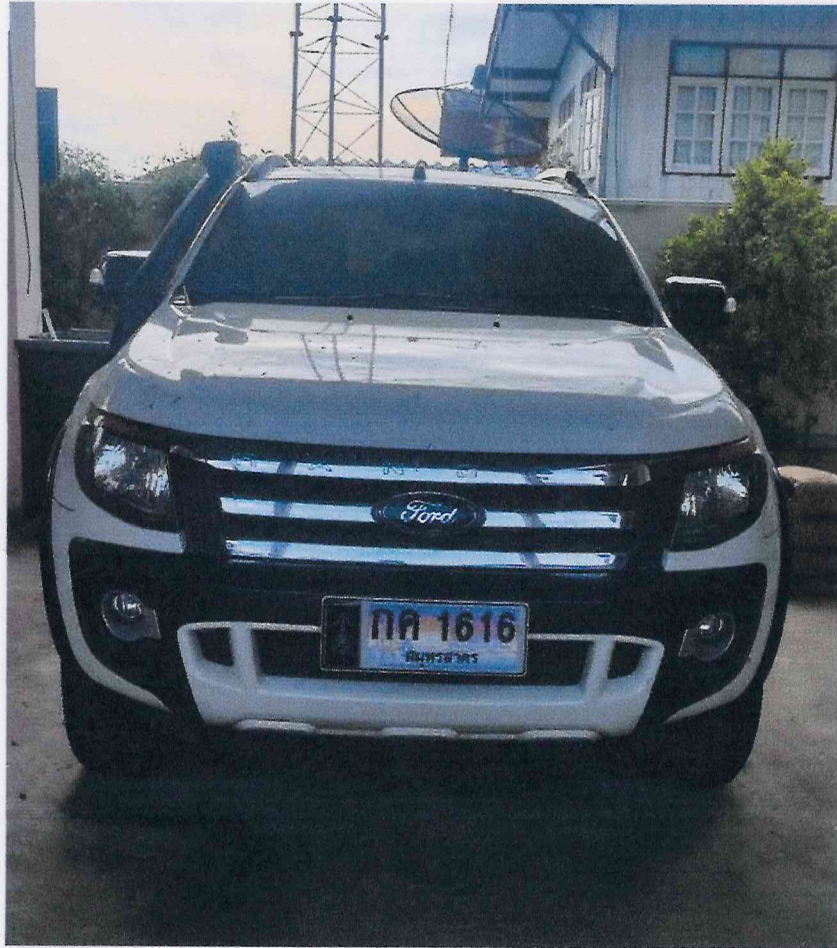
ภาพถ่ายรถยนต์หมายเลขทะเบียน กค ๑๖๑๖ สมุทรสาคร